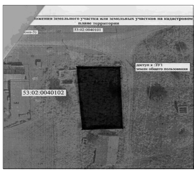
Приложение № 3 к постановлению Администрации муниципального района от 11.08.2021 № 2233