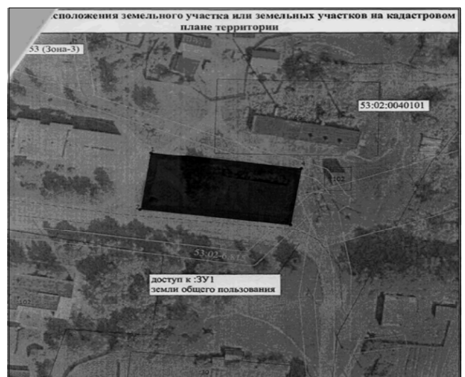
Приложение № 4 к постановлению Администрации муниципального района от 11.08.2021 № 2233